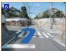
カーブミラーの十字路を左に曲がります。