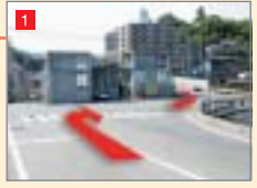
己斐橋を右折しすぐ左折します。