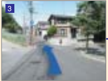
もみじが丘団地を抜けて左方向へ進みます。