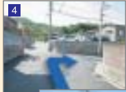
団地の突き当たりを左に曲がりすぐ右へと曲がります。