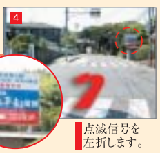
点滅信号を左折します。