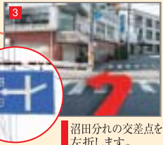
沼田分れの交差点を左折します。