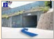
側道を下り、4号トンネルをくぐります。